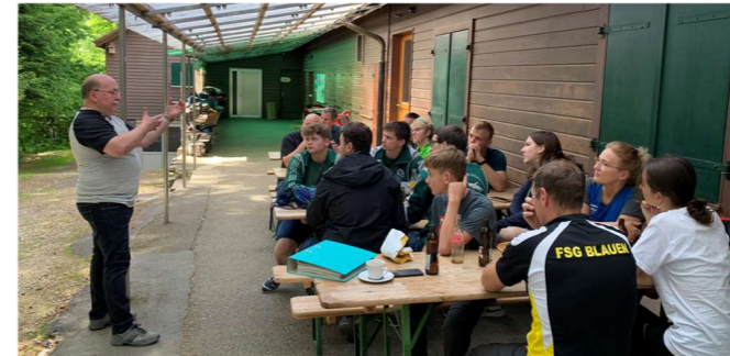
Schnupper- und Trainingstag in Laufen